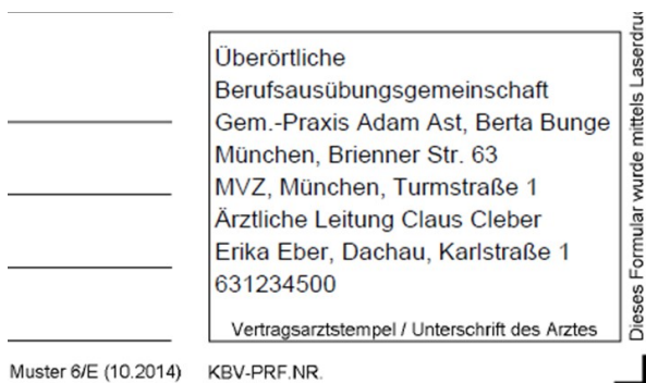
Abbildung 4: Formularfeld Vertragsarztstempel, Beispiel mit Arial 8 pt

In diesem Textfeld bringt das erstellende PVS die Inhalte des Vertragsarztstempels unter. Zusätzlich ist es dem erstellenden PVS gestattet, das Formularfeld für den Vertragsarztstempel hinsichtlich verwendeter Schriftart und Schriftgröße zu ändern. Weitere Eigenschaften wie Position, Größe etc. dürfen weder vom erstellenden noch vom auslesenden PVS geändert werden. So kann der Vertragsarztstempel durch das erstellende PVS an die Ansprüche der jeweiligen Gesamtvertragspartner angepasst werden. Dabei ist zu beachten, dass der Vertragsarztstempel menschenlesbar bleibt.