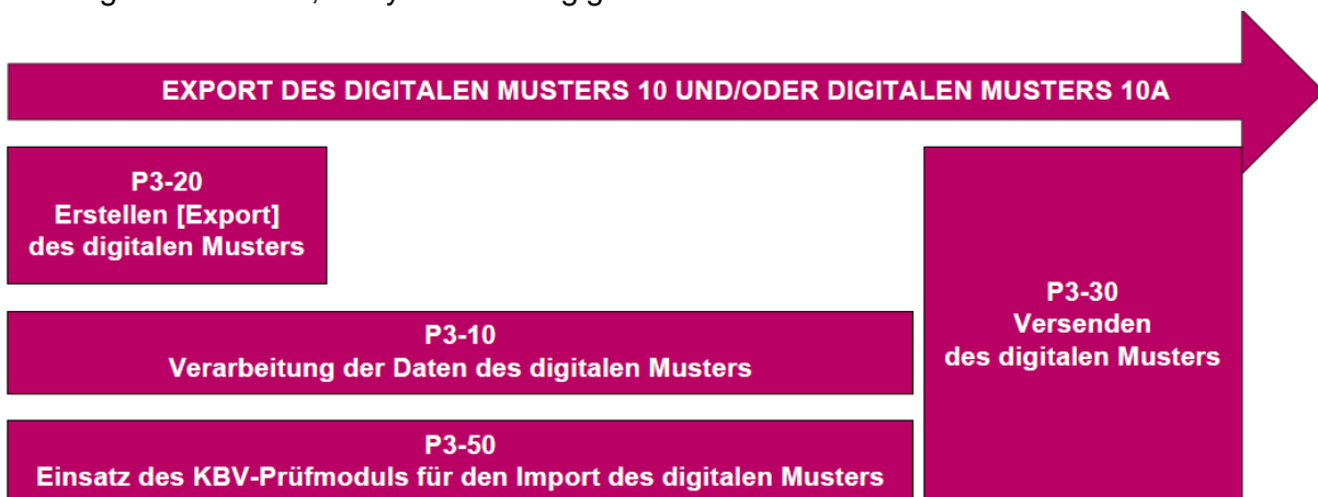
Abbildung 1: Export des digitalen Musters

Im Rahmen des Exports des digitalen Musters muss die Prüfung durch das Prüfmodul unbedingt noch vor dem Versenden des Musters erfolgen. An welcher Stelle genau die Prüfungen stattfinden, ist systemabhängig und individuell durchführbar.