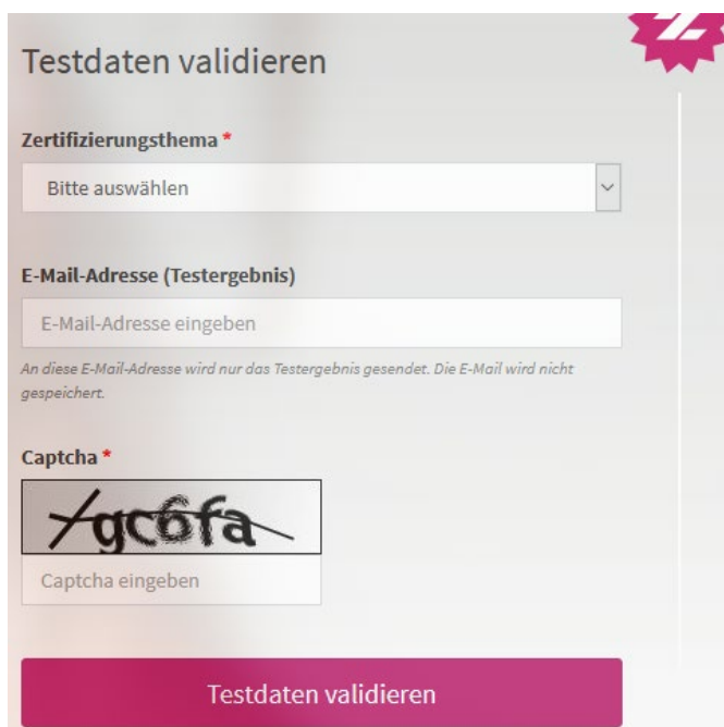
Abbildung 3: Testdatenvalidierung

Die übermittelten Testdaten werden auf Vollständigkeit und Korrektheit automatisiert geprüft. Eine manuelle Prüfung der eingereichten Unterlagen durch Mitarbeitende der KBV findet nicht statt, demzufolge ist der Ordner „Dokumentation“ im Gegensatz zur Zertifizierung nicht Gegenstand der Testdatenvalidierung. Nach dem das Thema ausgewählt wurde, kann das zip-Archiv mit den Prüfunterlagen hochgeladen werden. An die angegebene E-Mail-Adresse werden die Testergebnisse gesendet.